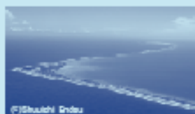
空から見たフナフナ島